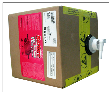
3) 打开盖子装上配套的水龙头